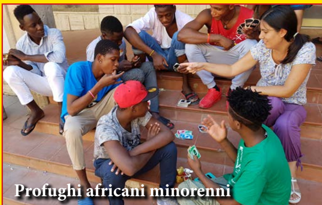
Profughi africani minorenni