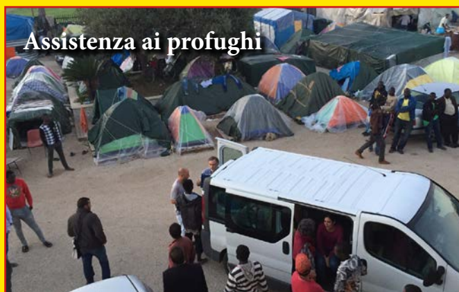
Assistenza ai profughi