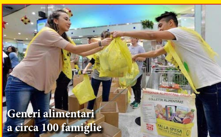
Generi alimentari a circa 100 famiglie