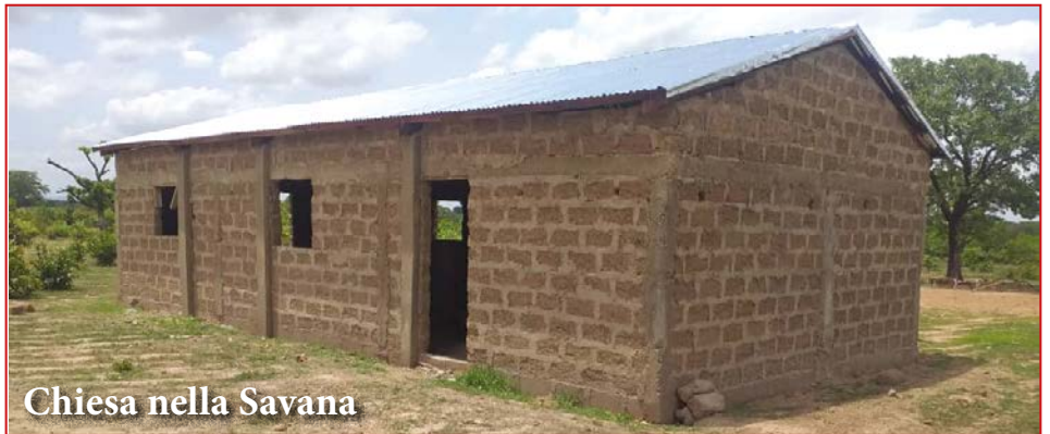
Chiesa nella Savana

Da oltre trent'anni, sosteniamo alcuni progetti in questo paese attraverso dei fedeli collaboratori locali che servono il Signore affrontando sfide di vario genere. Le nostre visite regolari a quanti vi sono impegnati, ci permettono di recare poi il necessario incoraggiamento e aiuti particolari di cui necessitano. I servizi prestati e utili ad una popolazione davvero bisognosa, sono offerti nelle scuole attraverso insegnamenti sull'etica e sulla morale e tra le famiglie attraverso corsi e consulenza per le coppie. La libertà di insegnare la Parola di Dio e invitare gli studenti al ravvedimento, è qualcosa di meraviglioso e impensabile alle nostre latitudini, considerando poi il fatto di avere spesso a che fare con dirigenti scolastici musulmani! Oltre alla regolare evangelizzazione, si inaugurano regolarmente nuove chiese e sono offerti corsi di discepolato e formazioni