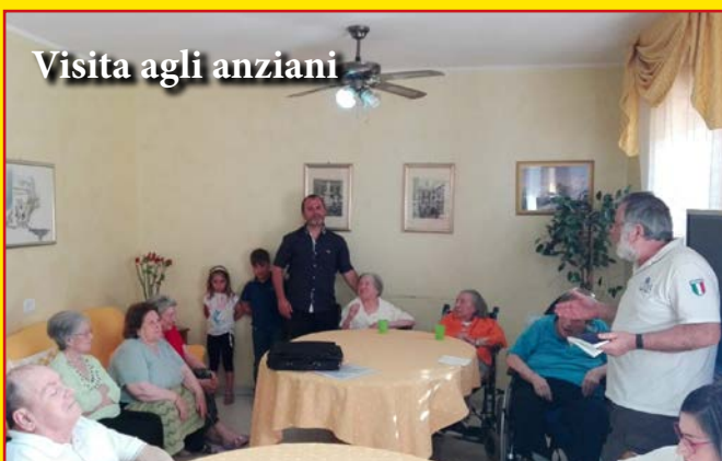
Visita agli anziani