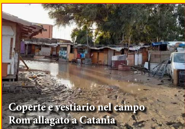
Coperte e vestiario nel campo Rom allagato a Catania