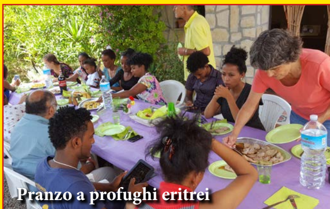
Pranzo a profughi eritrei